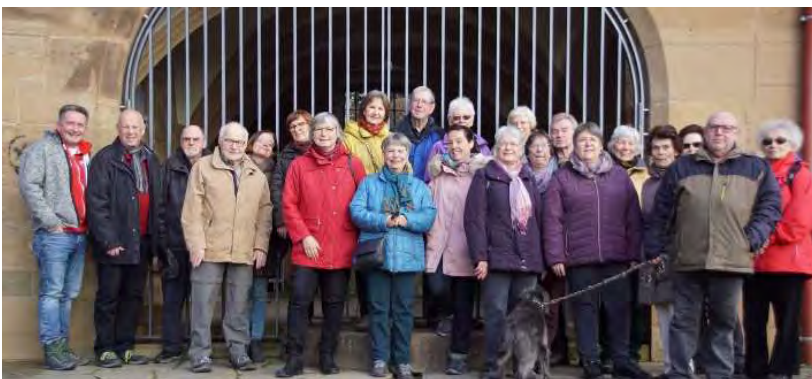
2012 Bad Wimpfen, 2018 Jägerhaus, 2020 Cäcilienbrunnen