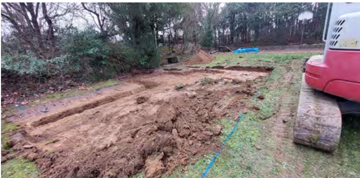
Grafik: Vanessa Schumacher