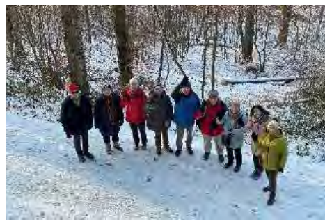
2015 Weinsberg, 2022 Untergruppenbach, 2022 Löwenstein, 2021 Wartberg, 2022 Jägerhaus